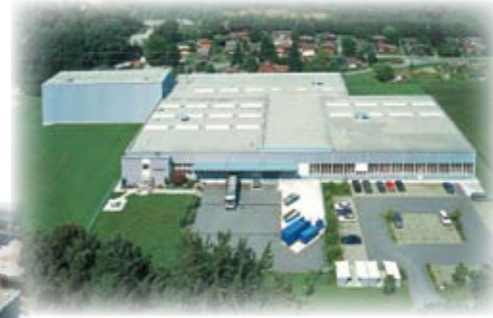
1993 Bezug Werk Hölstein