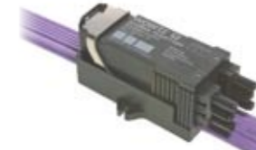
2007 Neuer Auftritt der Firma Woertz AG - Frischer Wind Eigene Flachkabelproduktion