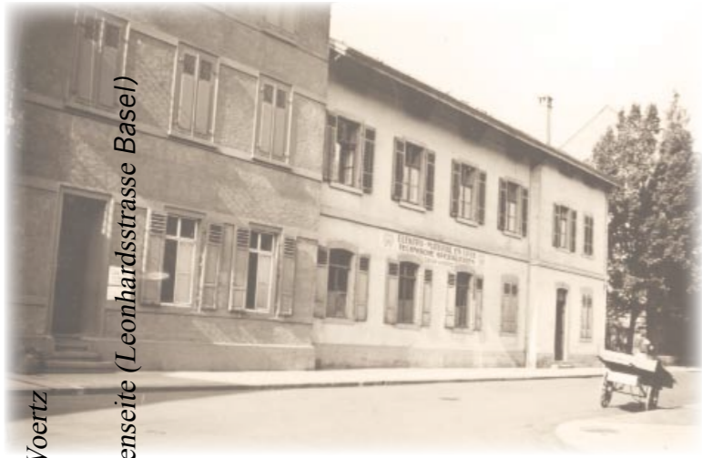
1928 Gründung der Firma Oskar Woertz