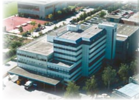
1983 Muttenz in Betrieb genommen